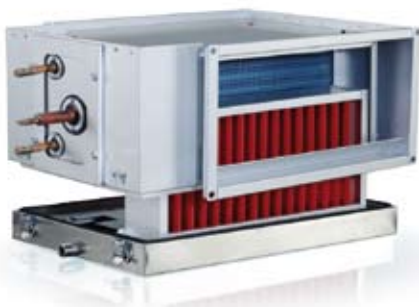
PGDX ja asennettu pisaraerotin, DE

PGDX asennetaan vaakasuoraan kanavaan vapaasti valittavaan ilmavirran suuntaan (käännettävä patteriosa).